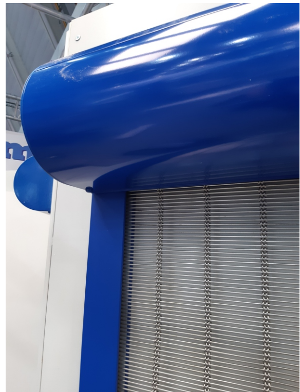
Bild Aquaris 4: Aquaris - Edelstahl-Gewebe im oberen Bereich des Behangs